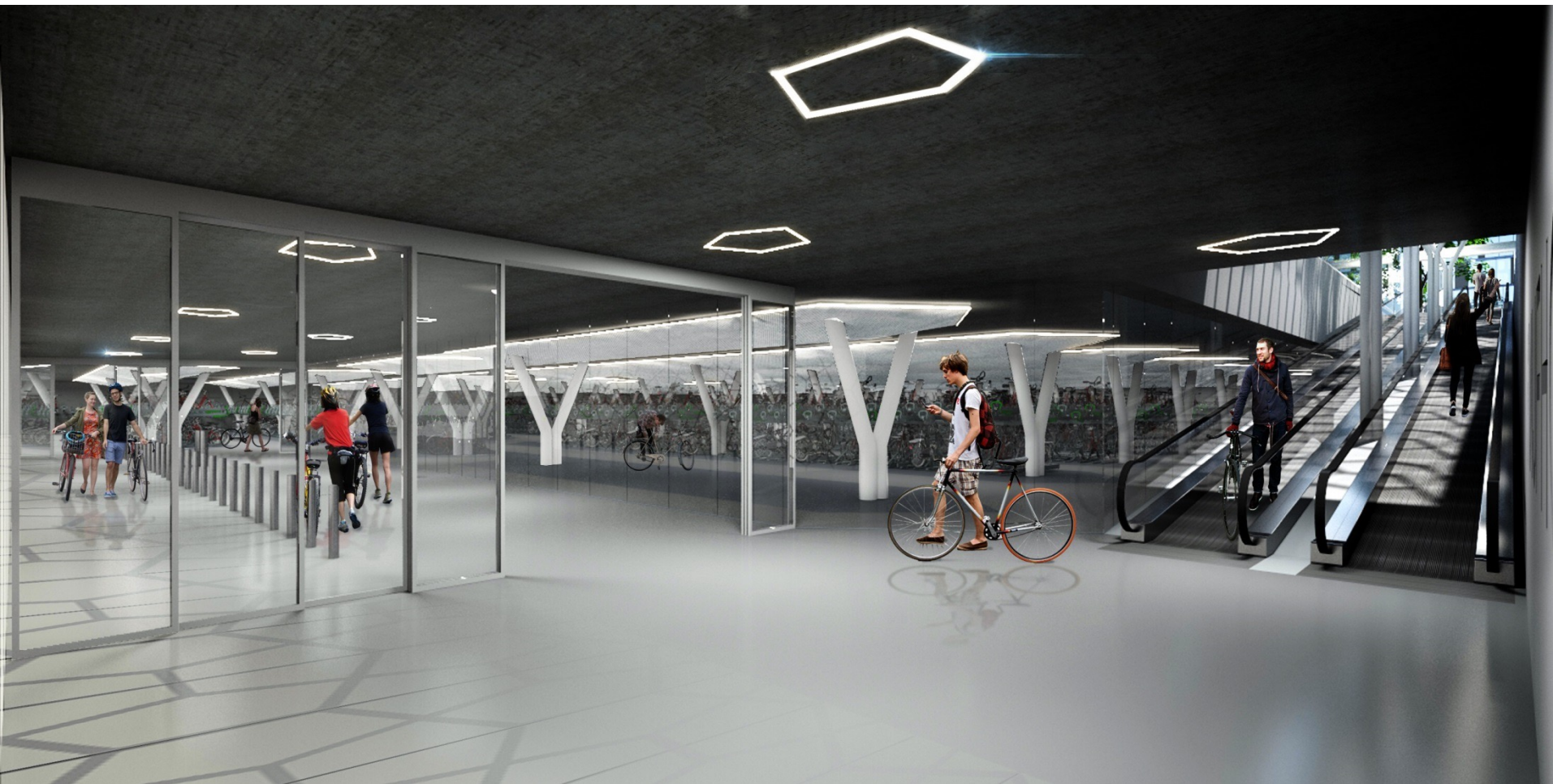
Fietsparkeergarage Vijfhoek (Strawinsky?)